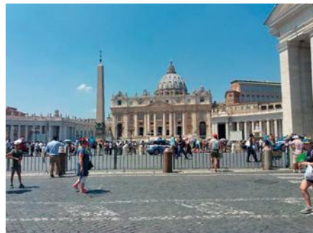
Petersplatz und Petersdom