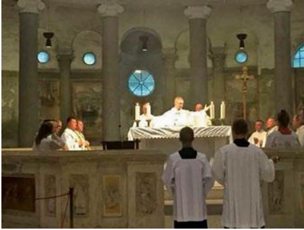
Abschlussmesse mit allen Teilnehmern aus dem Erzbistum und mit Erzbischof Dr. Heße in der Basilica Santo Stefano Rotondo

Quelle: Erzbistum Hamburg Referat Kinder & Jugend